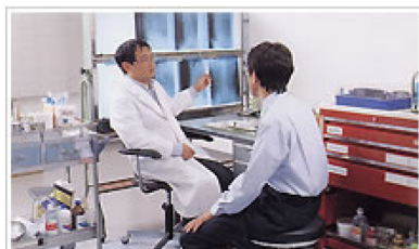
外来・救急診察室