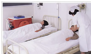
外来安静室 (1日安静室)