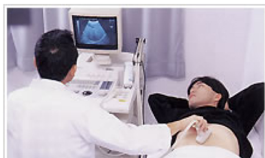
内視鏡・超音波診察室